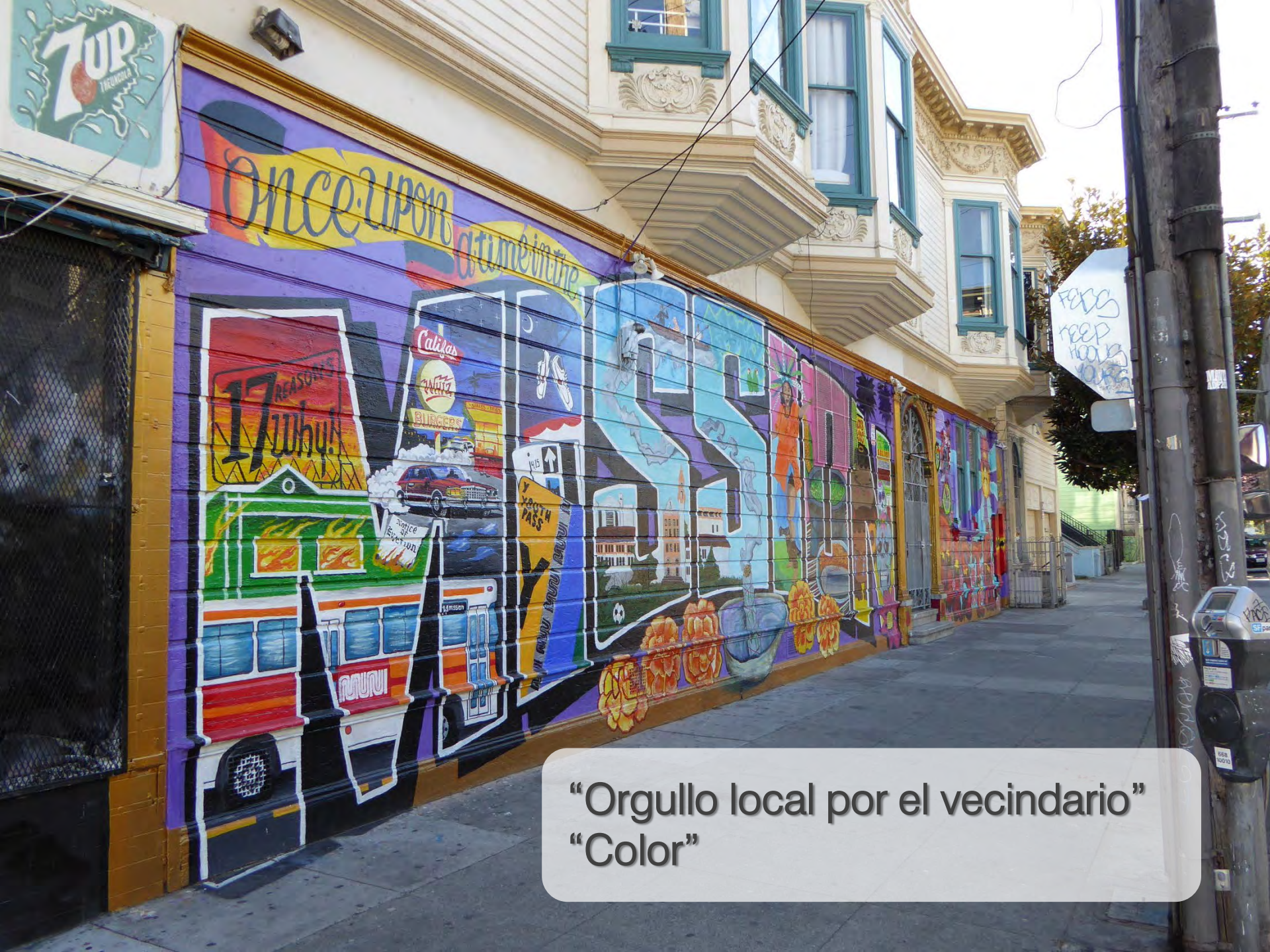
“Orgullo local por el vecindario” “Color”